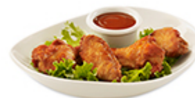
Ailes de poulet (4) 4,99$