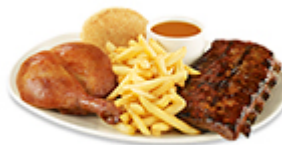
Quart de poulet cuisse et côtes levées