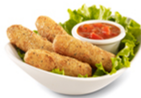
Bâtonnets de fromage (4) 5,79$