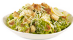
Salade César St-Hubert (végétarienne, sans bacon)