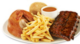
Quart de poulet poitrine et côtes levées