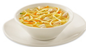
Soupe poulet et nouilles