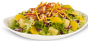
Salade Bangkok avec des nouilles de riz frites