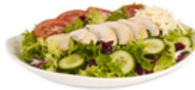
Salade classique St-Hubert (végétarienne)