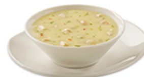
Soupe crème de poulet